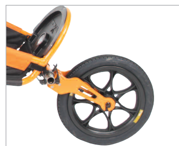
xRover i øvre tiltposisjon