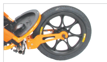
xRover i nedre tiltposisjon