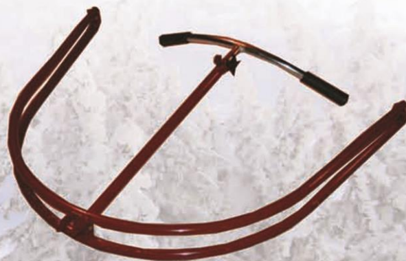
Enkel å oppbevare og transportere.