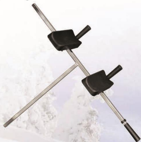
Tilbehør: Håndtak med underarmstøtter